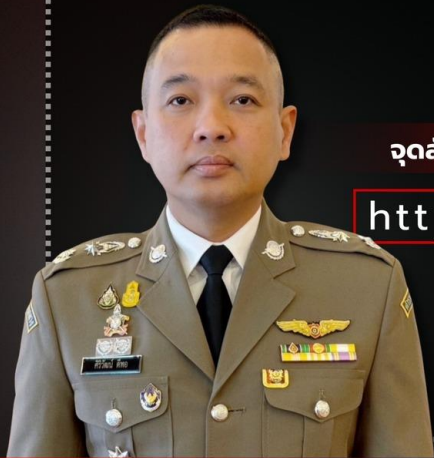
พล.ต.ต.ศิริวัฒน์ ดีพอ รองโฆษกสำนักงานตำรวจแห่งชาติ

ส่วน Path ทำหลอก มี .go.th ให้ดูเหมือนเว็บไซต์ราชการ สังเกตว่ามีเครื่องหมาย / ด้านหน้า